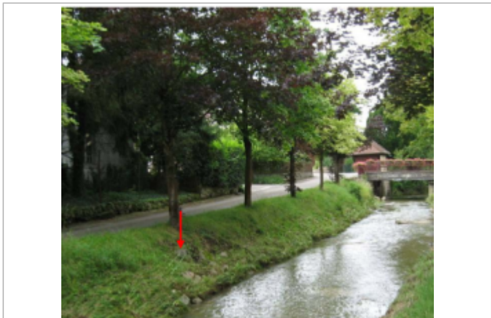
Haut de l'enrochement en rive gauche