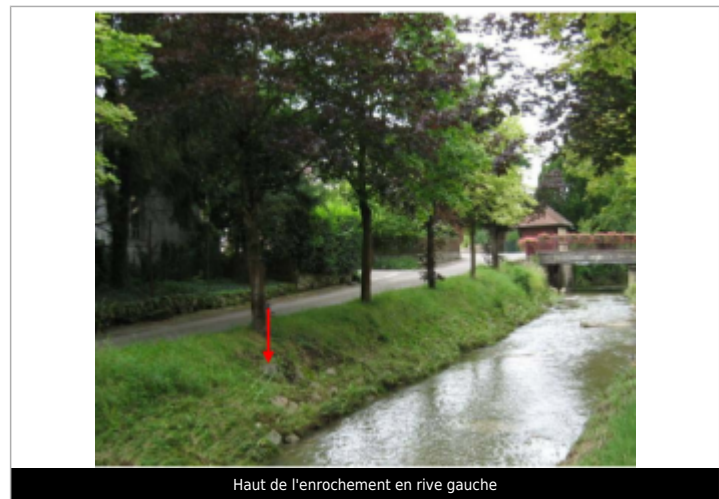
Haut de l'enrochement en rive gauche