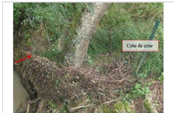
photo repère de crue