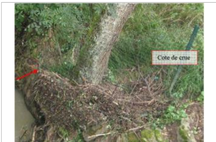
photo repère de crue

PONT COMMUNAL RIVE GAUCHE : COTE DU FIL PERPENDICULAIRE AU POTEAU AU DROIT DU TRONC D'ARBRE - 01/04/2008