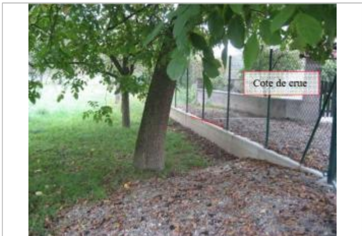
photo repère de crue