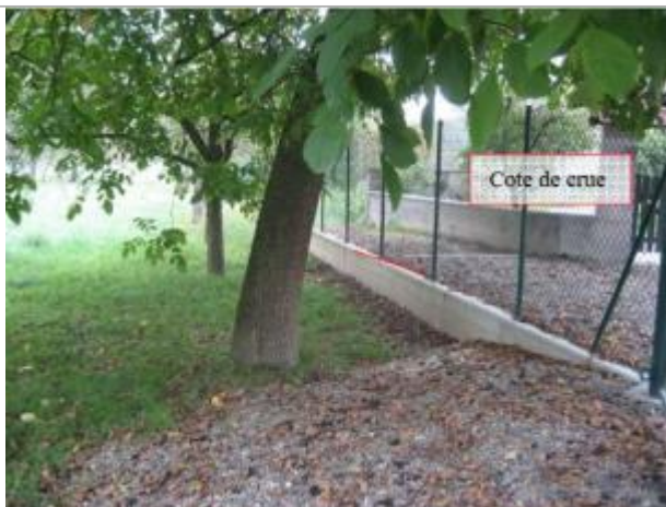
photo repère de crue