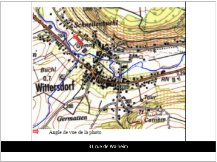
31 rue de Walheim