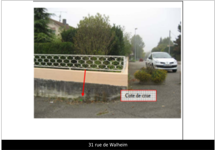
31 rue de Walheim