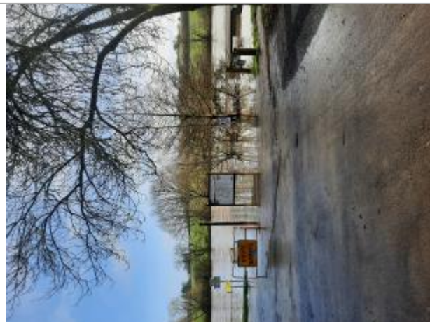
Vue sur la laisse d'inondation

Coordonnées WGS84 : X: -0.66656501 / Y: 47.71938100