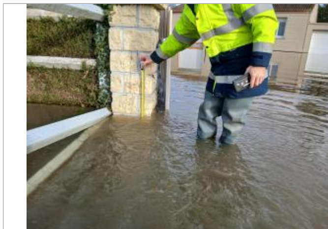
Pilier gauche du portail du 14 route de Perriers à Charleval