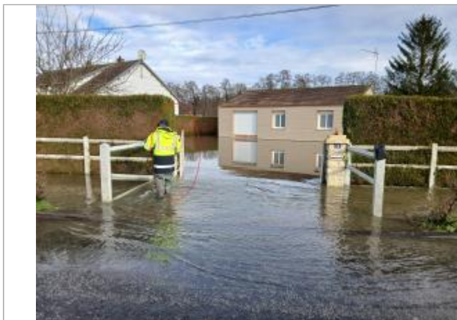
Vue depuis la route de Perrier