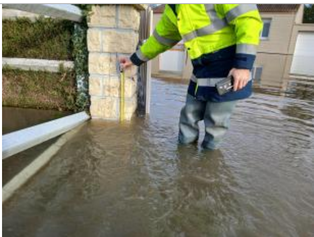
Pilier gauche du portail du 14 route de Perriers à Charleval

Altitude calculée de l'eau (en m) : 34.865 m