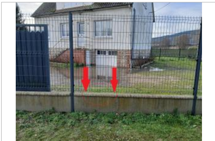
Leau est passé au dessus du muret à 45 cm/sol

Maximum de l'inondation : Non Visibilité : Oui État du repère : Mauvais Pérennité : Aucune