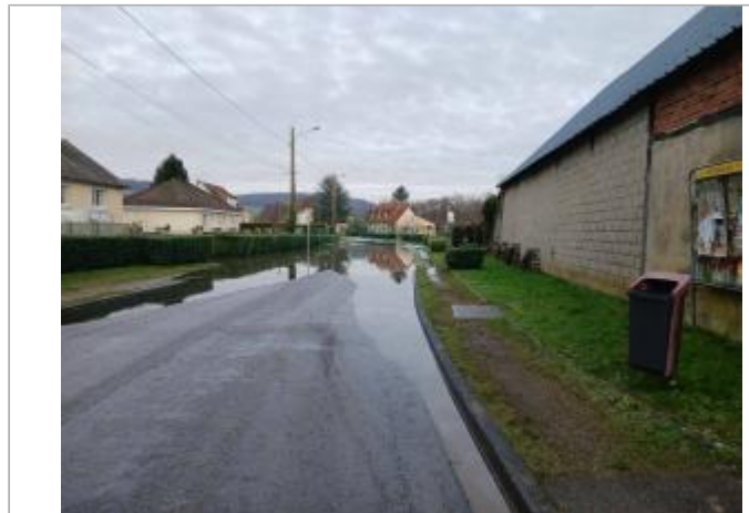
Panneau "stop" sur la route de Perriers (D1)

Coordonnées WGS84 : X: 1.38052303 / Y: 49.37622620