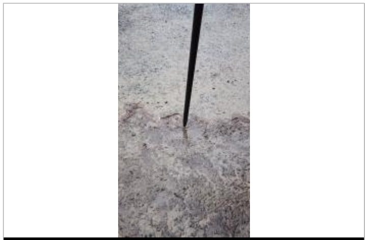
Vue sur le point de la mesure

NIVELLEMENT RÉALISÉ PAR LE SPC MLA - 10/01/2025 Méthode : GPS Référence nivelée : Marque d'inondation Système altimétrique : NGF IGN 1969 (système normal) Altitude de la référence (en m) : 56.360 m Altitude calculée de l'eau (en m) : 56.36 m