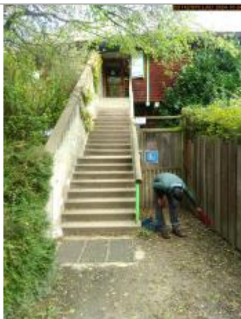
Vue éloignée du repère en 2024

Altitude calculée de l'eau (en m) : 336.124 m