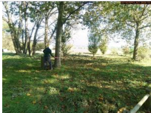
Vue du site en 2024, avec le repère de la crue du 17 octobre 2024

Coordonnées WGS84 : X: 4.17132533 / Y: 45.81359380