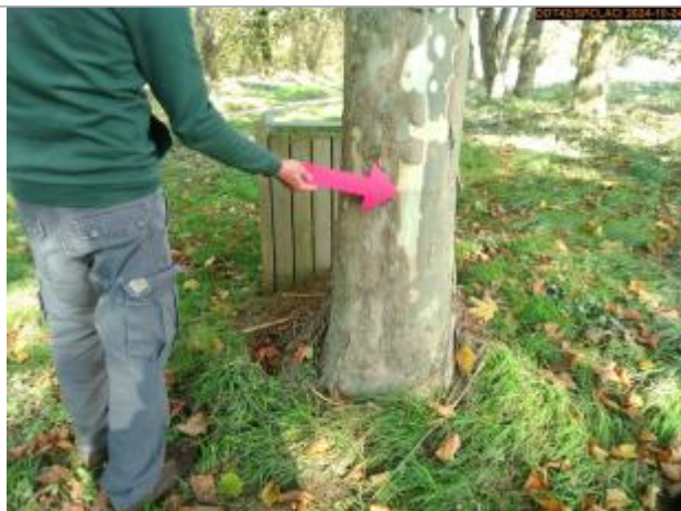
Vue du repère en 2024