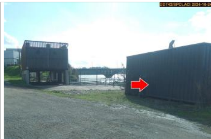
Vue du site en 2024, avec le repère de la crue du 17 octobre 2024

Coordonnées WGS84 : X: 4.21253981 / Y: 45.74387730