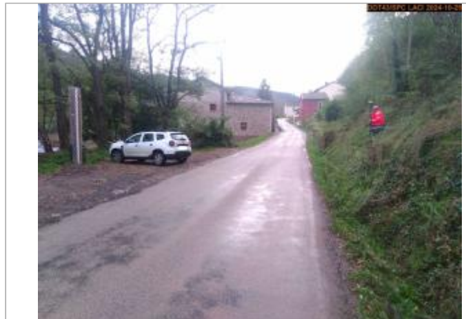
Vue du site en 2024, avec le repère de la crue du 17 octobre 2024

Coordonnées WGS84 : X: 4.13076598 / Y: 45.25523440