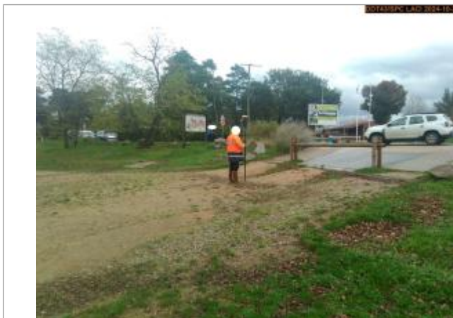
Vue du site en 2024, avec le repère de la crue du 17 octobre 2024

Coordonnées WGS84 : X: 4.11796887 / Y: 45.30771970