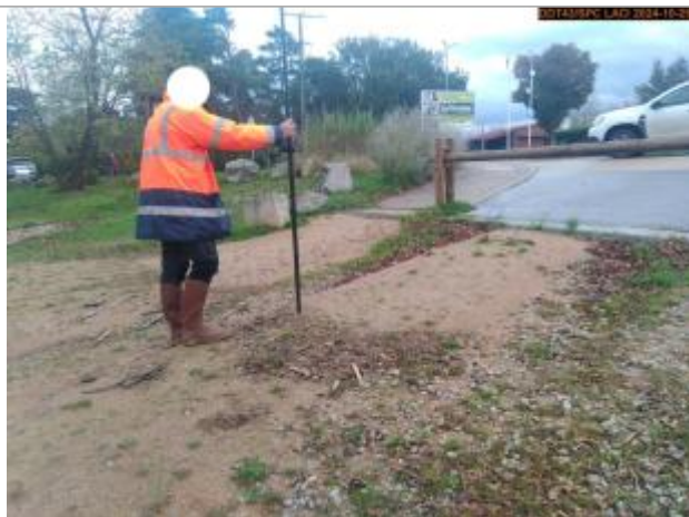
Vue du repère, en 2024

Altitude calculée de l'eau (en m) : 443.464 m