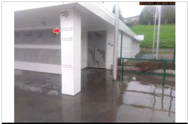
Vue du repère, pendant la crue d'octobre 2024

GÉNÉRAL Code : 25LACILO2_R_55_4 Date de mise à jour : 28/01/2025 Auteur : SPC LACI