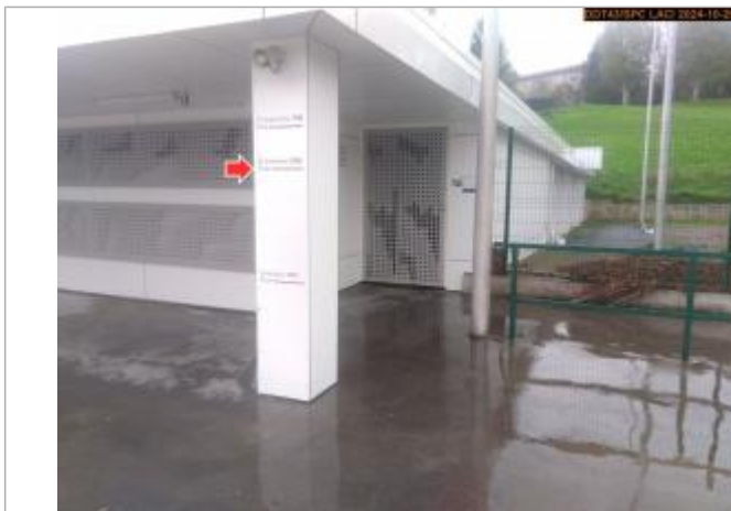
Vue du repère, pendant la crue d'octobre 2024