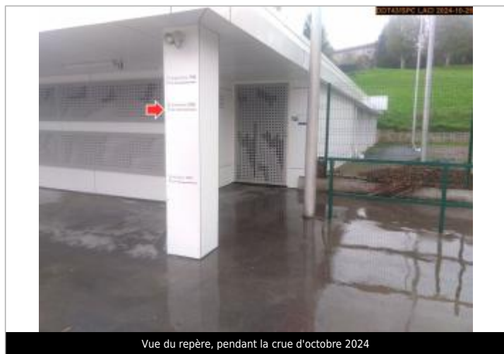
Vue du repère, pendant la crue d'octobre 2024

Texte : 02 novembre 2008 - Crue Maximum de l'inondation : Oui Visibilité : Oui État du repère : Disparu Pérennité : Aucune Repère calculé : Non renseigné PHEC : Non renseigné