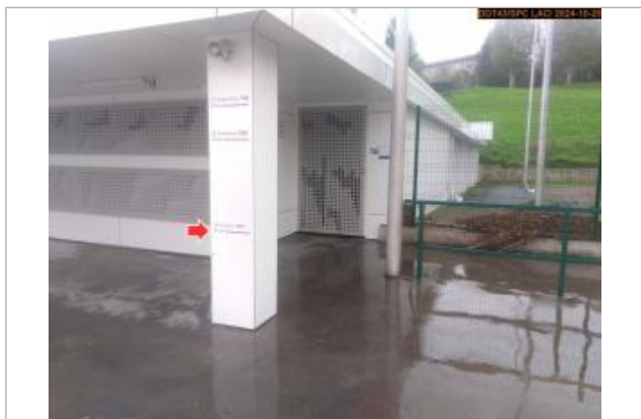
Vue du repère, pendant la crue d'octobre 2024

Texte : 16 octobre 1907 - Crue Maximum de l'inondation : Oui Visibilité : Oui État du repère : Disparu Pérennité : Aucune Repère calculé : Non renseigné PHEC : Non renseigné