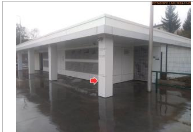
Vue du site en 2024, avec le repère de la crue du 17 octobre 2024

Coordonnées WGS84 : X: 4.03263460 / Y: 45.19928130