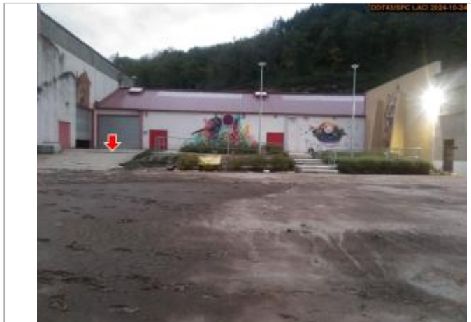
Vue du site en 2024, avec le repère de la crue du 17 octobre 2024

Coordonnées WGS84 : X: 4.19529706 / Y: 45.37094760