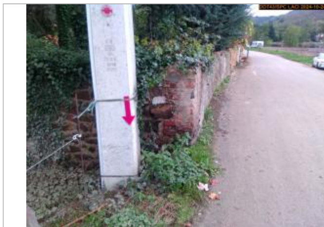
Vue du repère, en 2024