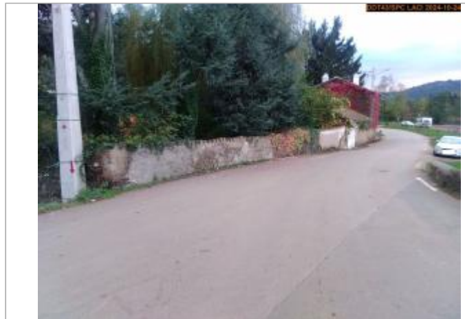
Vue du site en 2024, avec le repère de la crue du 17 octobre 2024

Coordonnées WGS84 : X: 4.22298824 / Y: 45.38300750