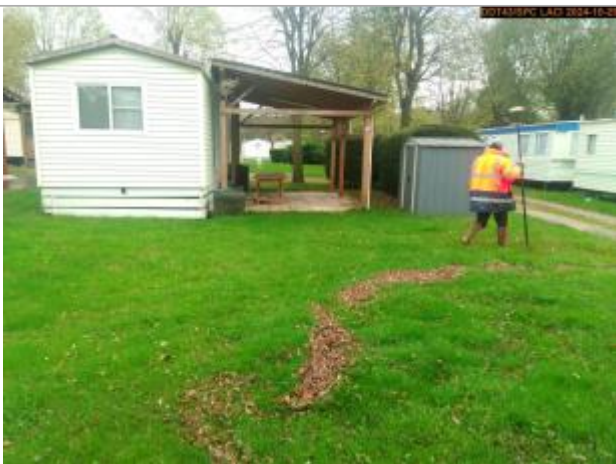
Vue du repère, en 2024