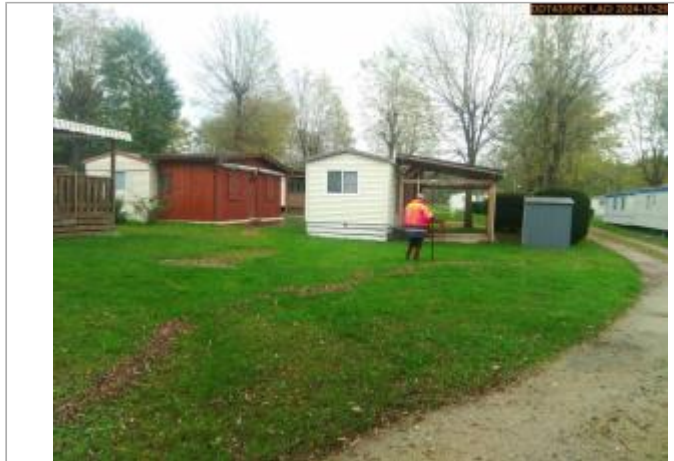
Vue du site en 2024, avec le repère de la crue du 17 octobre 2024

Coordonnées WGS84 : X: 4.11987970 / Y: 45.29373660