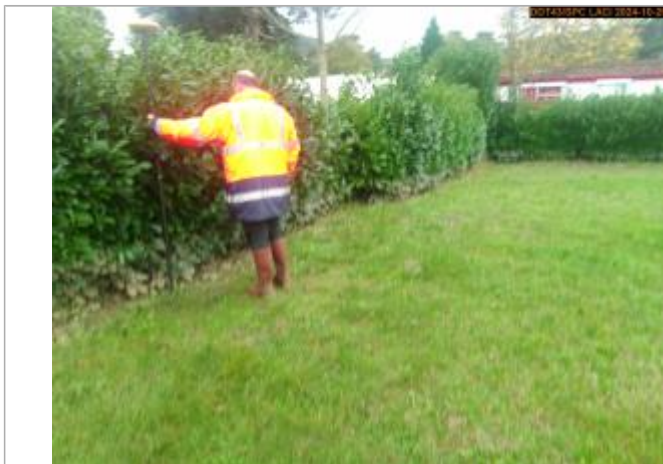
Vue du repère, en 2024

Altitude calculée de l'eau (en m) : 443.636