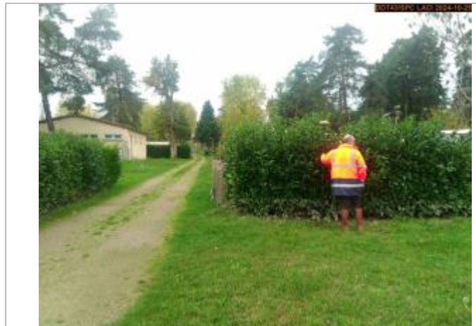
Vue du site en 2024, avec le repère de la crue du 17 octobre 2024

Coordonnées WGS84 : X: 4.12254874 / Y: 45.31219780