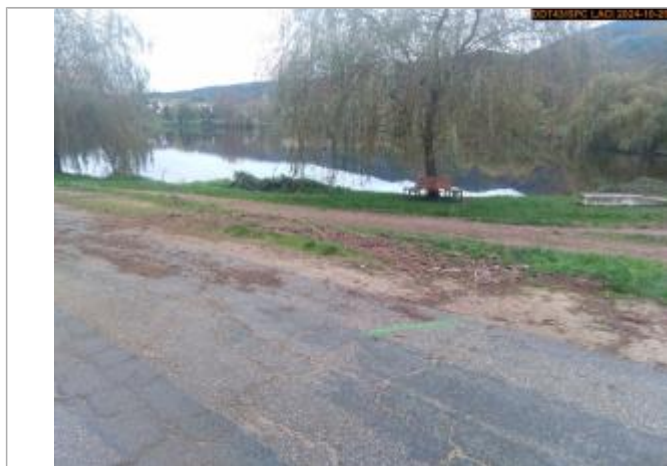
Vue du repère, en 2024