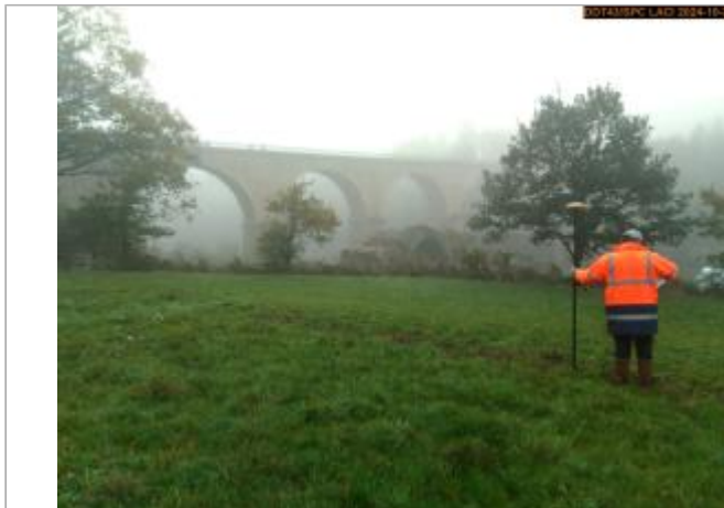
Vue du site en 2024, avec le repère de la crue du 17 octobre 2024

Coordonnées WGS84 : X: 3.89844697 / Y: 45.12023250