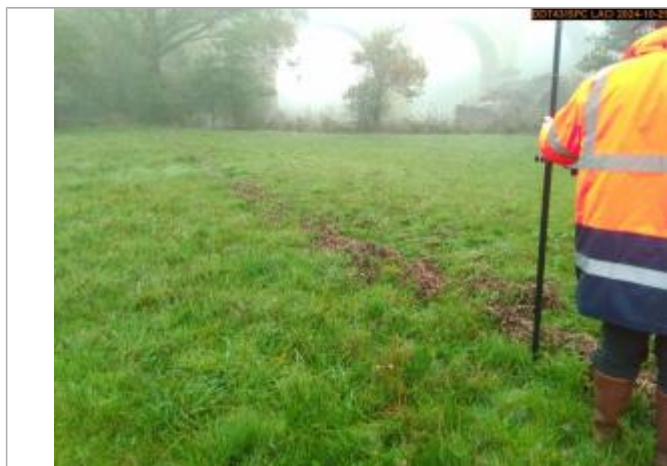
Vue du repère, en 2024