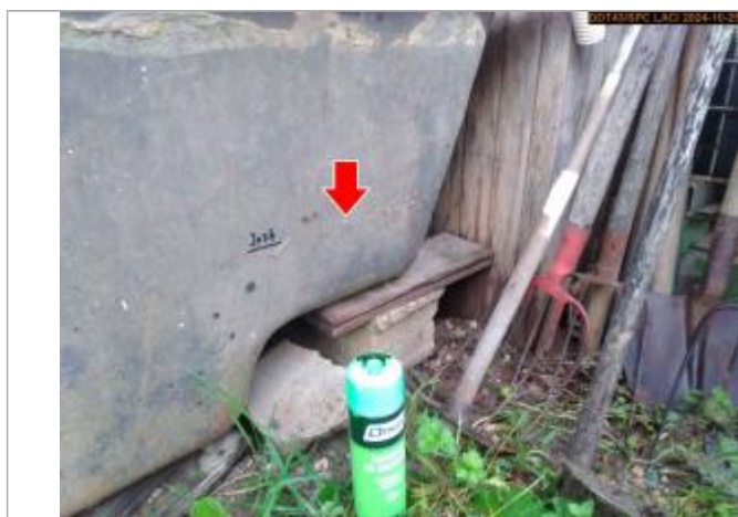
Vue du repère, en 2024