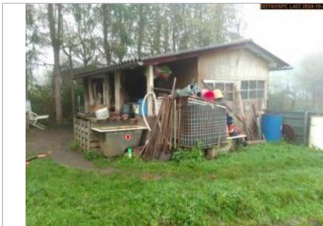
Vue du site en 2024, avec le repère de la crue du 17 octobre 2024

Coordonnées WGS84 : X: 3.91535280 / Y: 45.12046950