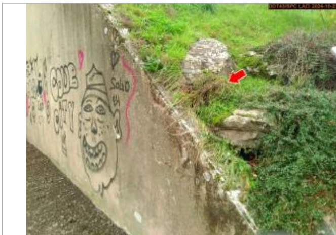
Vue du repère, en 2024