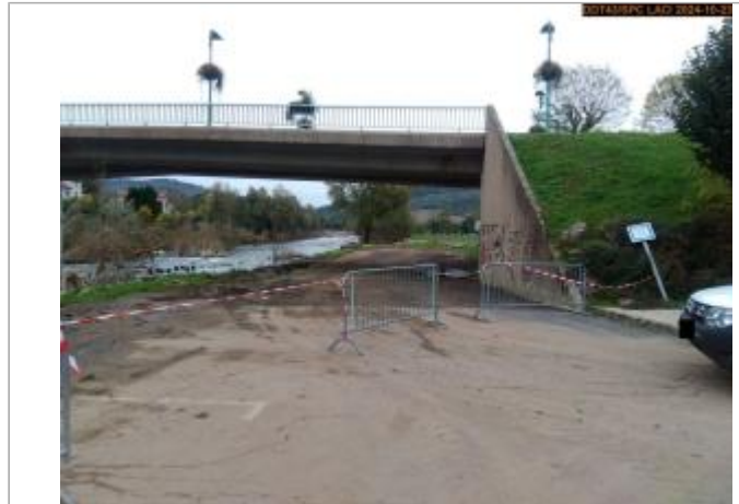
Vue du site en 2024, avec le repère de la crue du 17 octobre 2024

Coordonnées WGS84 : X: 3.91713622 / Y: 44.99768020