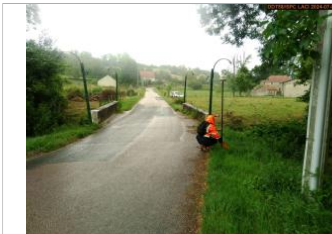
Vue du site en 2024, et du repère de la crue de juin 2024