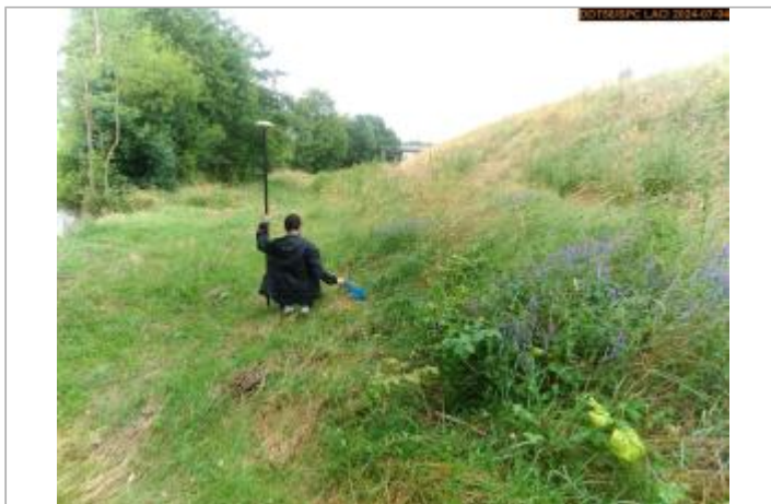
Vue du site en 2024, et du repère de la crue de juin 2024