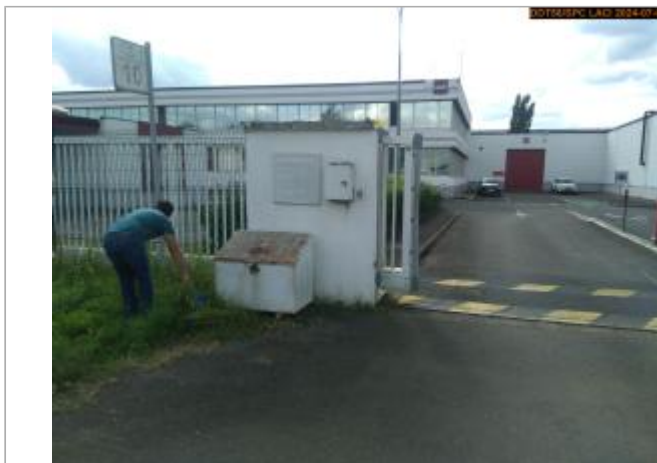
Vue du site en 2024, et du repère de la crue de juin 2024