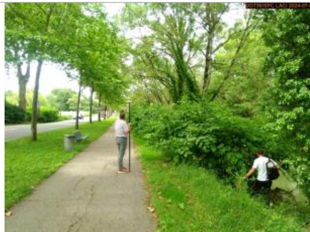
Vue du site en 2024, et du repère de la crue de juin 2024