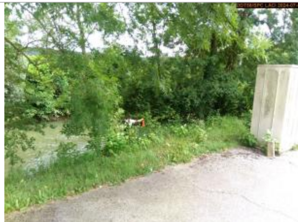
Vue du site en 2024, et du repère de la crue de juin 2024