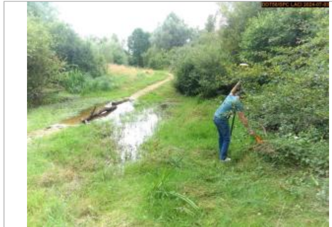
Vue du site en 2024, et du repère de la crue de juin 2024

Coordonnées WGS84 : X: 3.18994734 / Y: 47.00428650