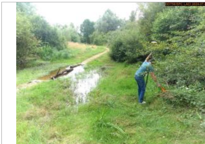
Vue du site en 2024, et du repère de la crue de juin 2024