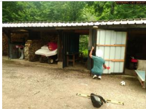
Vue du site en 2024, et du repère de la crue de juin 2024