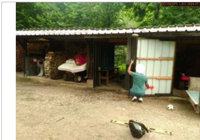
Vue du site en 2024, et du repère de la crue de juin 2024

Coordonnées WGS84 : X: 3.18846665 / Y: 47.09380270