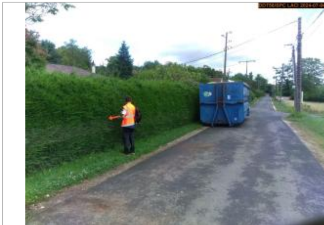
Vue du site en 2024, et du repère de la crue de juin 2024