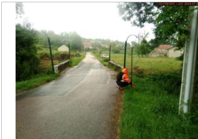
Vue du site en 2024, et du repère de la crue de juin 2024