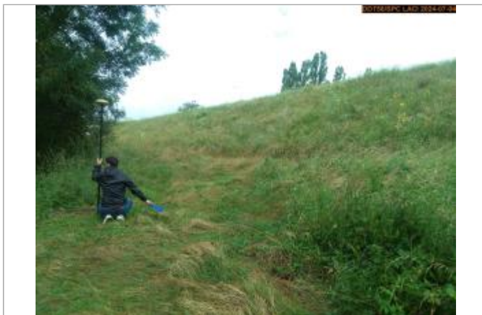
Vue du site en 2024, et du repère de la crue de juin 2024