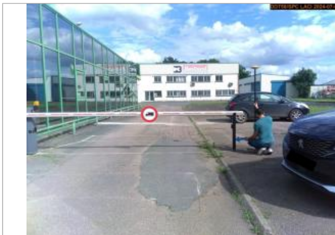
Vue du site en 2024, et du repère de la crue de juin 2024

Coordonnées WGS84 : X: 3.19470506 / Y: 46.99910940