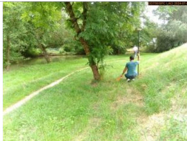
Vue du site en 2024, et du repère de la crue de juin 2024