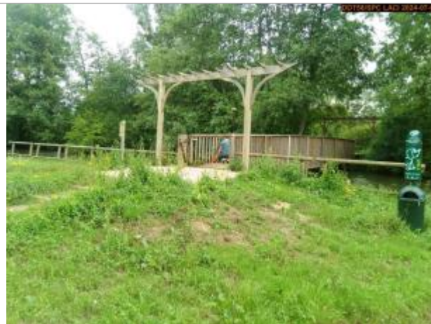
Vue du site en 2024, et du repère de la crue de juin 2024