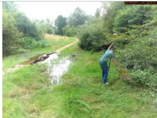
Vue du site en 2024, et du repère de la crue de juin 2024