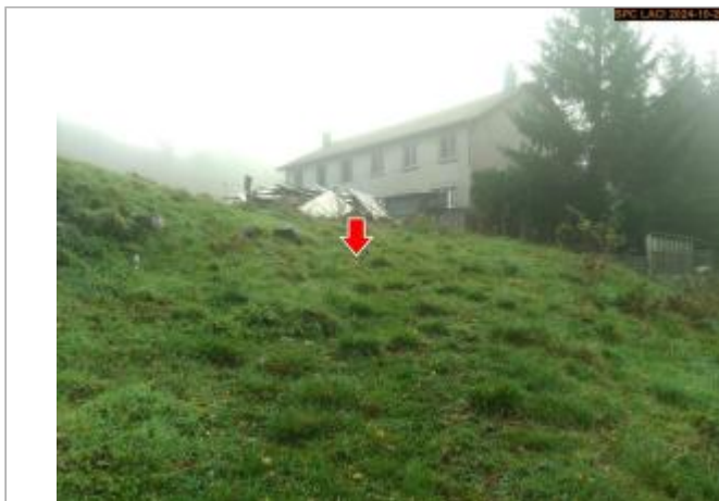
Vue du site en 2024, avec le repère de la crue du 17 octobre 2024

Coordonnées WGS84 : X: 3.85878662 / Y: 44.73435220