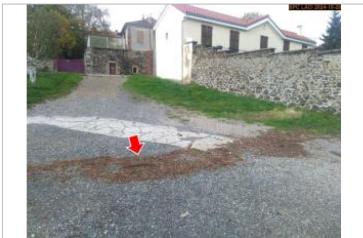
Vue du repère en 2024