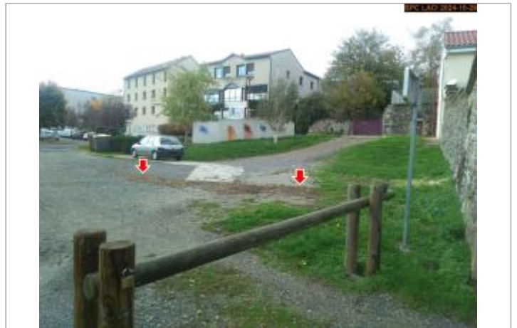
Vue du site en 2024, avec le repère de la crue du 17 octobre 2024

Coordonnées WGS84 : X: 3.85489157 / Y: 44.72472940