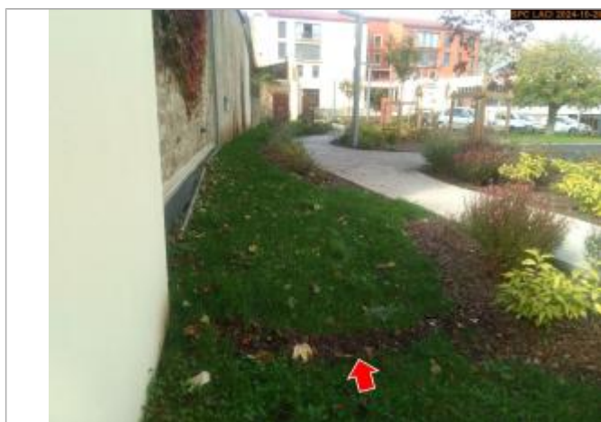
Vue du repère en 2024