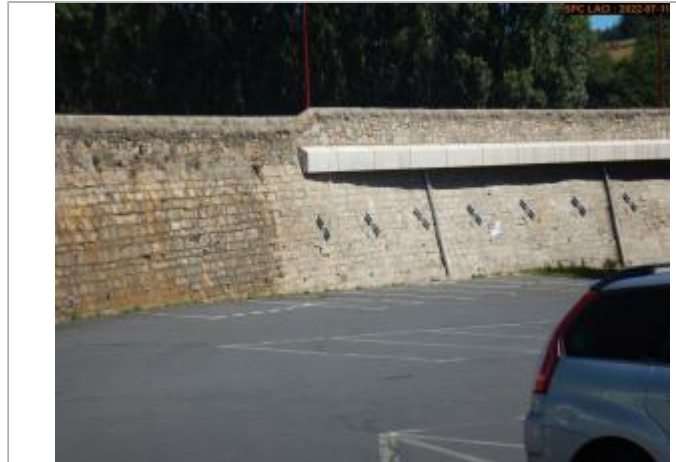
Vue du site éloignée

Coordonnées WGS84 : X: 3.85738860 / Y: 44.73462100