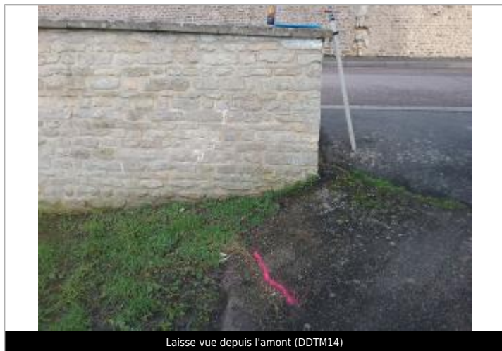
Laisse vue depuis l'amont (DDTM14)