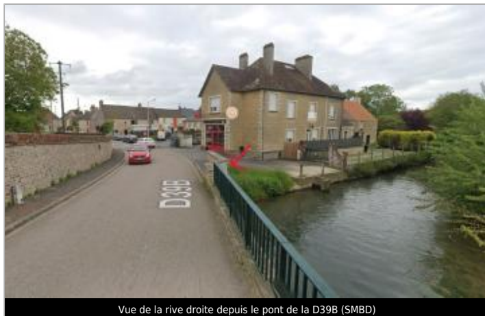
Vue de la rive droite depuis le pont de la D39B (SMBD)

Coordonnées WGS84 : X: -0.06842470 / Y: 48.92373480