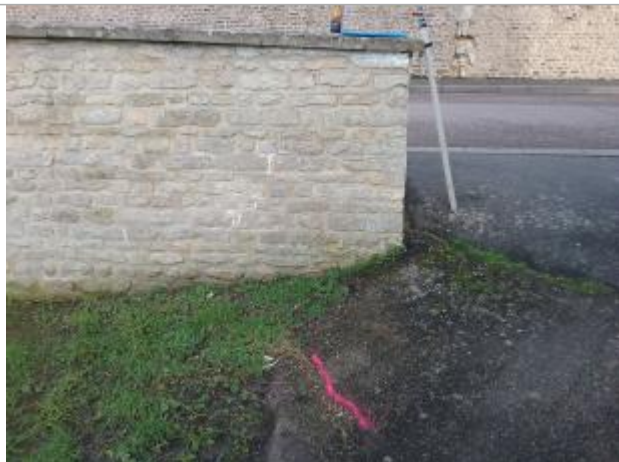
Laisse vue depuis l'amont (DDTM14)

NIVELLEMENT SPC SACN. LE SPC N'EST PAS GÉOMÈTRE EXPERT, LES COTES SONT DONNÉES À TITRE INDICATIF. - 23/05/2025