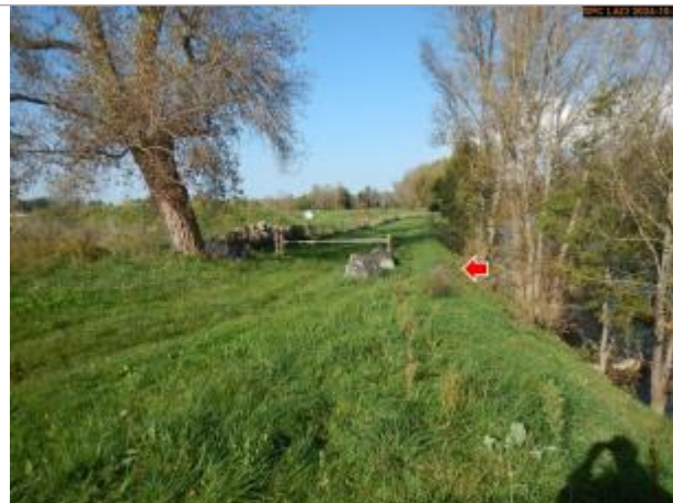
Vue du site en 2024, avec le repère de la crue d'octobre 2024