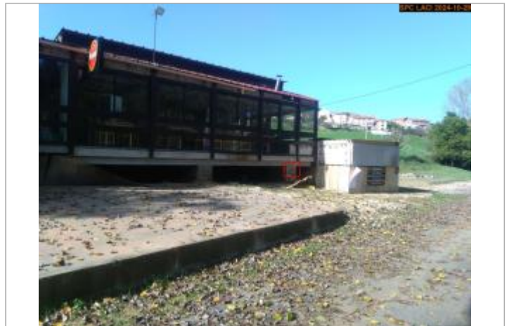
Vue du site en 2024, avec le repère de la crue d'octobre 2024