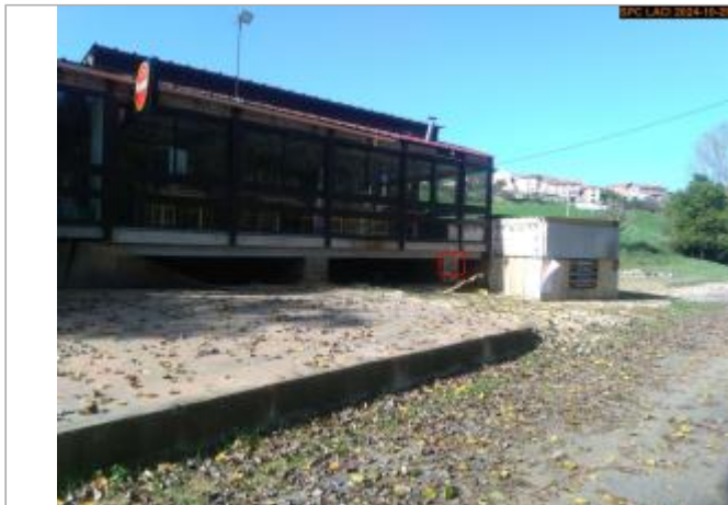
Vue du site en 2024, avec le repère de la crue d'octobre 2024