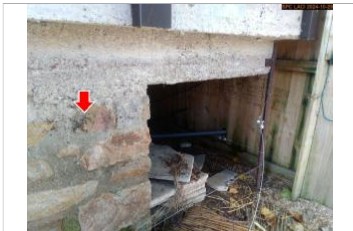
Vue du repère, en 2024