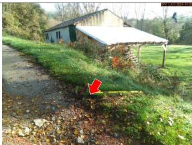
Vue du repère, en 2024