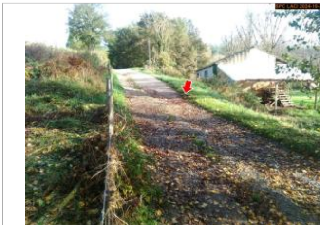
Vue du site en 2024, avec le repère de la crue d'octobre 2024

Coordonnées WGS84 : X: 3.44211400 / Y: 45.15140600