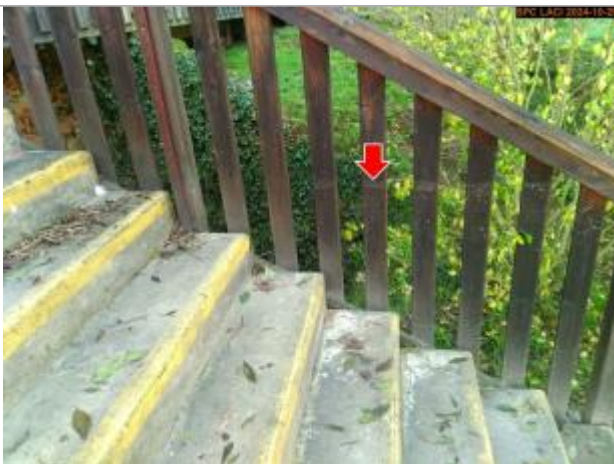
Vue du repère, en 2024

Altitude calculée de l'eau (en m) : 473.318 m