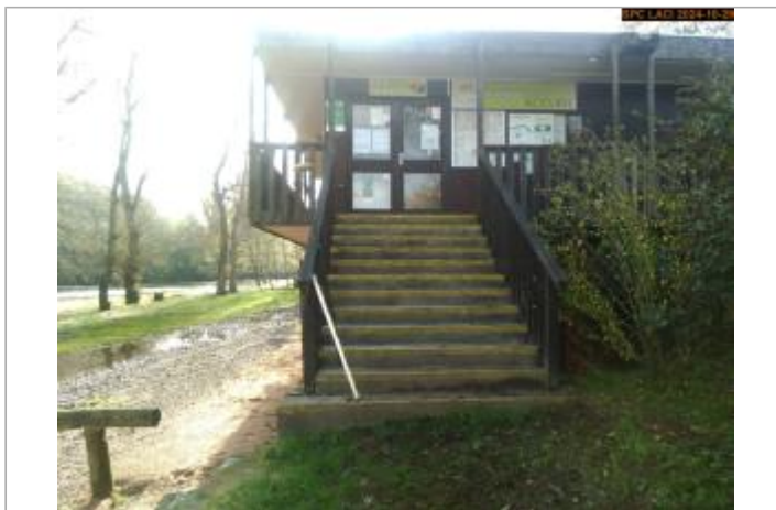
Vue du site en 2024, avec le repère de la crue d'octobre 2024