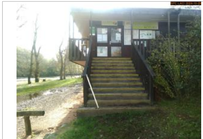
Vue du site en 2024, avec le repère de la crue d'octobre 2024

Coordonnées WGS84 : X: 3.44313500 / Y: 45.15378900