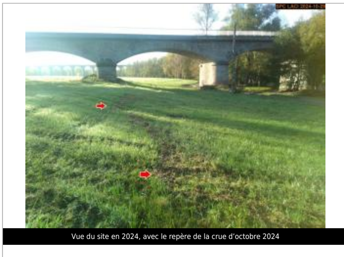
Vue du site en 2024, avec le repère de la crue d'octobre 2024