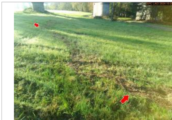
Vue du repère, en 2024