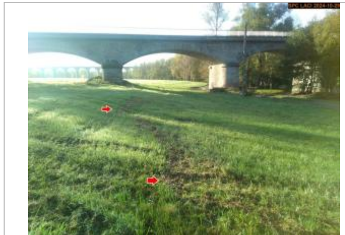
Vue du site en 2024, avec le repère de la crue d'octobre 2024

Coordonnées WGS84 : X: 3.49159100 / Y: 45.11692000